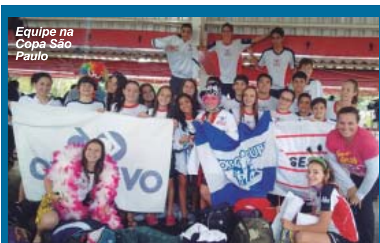
Equipe na Copa São Paulo

Competição que homenageou Luiz Lima contou com a participação de 576 nadadores